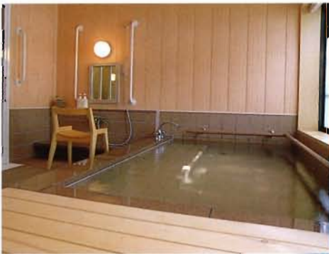
貸切風呂 梅など季節の変わり湯が好評です。水いらずのひとつきを家族でご夫婦でお過ごしください。

ひとりのために、みんなのために。 ひとつ先の、やさしさへ。 車椅子の方やお年を召された方も、 全ての方が心を交えて一緒に寛げる 十和田の自然にも似た やさしさをお伝えいたします。