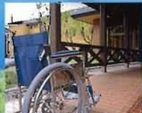
貸出用車椅子で 湖畔散策はいかが？ お客様の希望により自由 にお使いいただける貸出用 車椅子もございます。