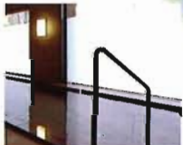
安全性プラス快適性の浴場 危険な段差を取り払い浴槽に は手すりをセット。より高い 安全性、快適性を求めました。