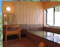
使い心地にこだわった貸切風呂 脱衣場、浴槽、洗い場に十分なスペースと細かい 機能を完備。座位保持椅子もご用意しています。 ◆脱衣室/内鍵有、入口開口部 90cm 幅 1m70cm 奥行 2m40cm ◆浴室/手すり、内鍵有、入口開口80cm 幅2m70cm 奥行3m ◆浴そう/幅2m20cm 奥行1m40cm