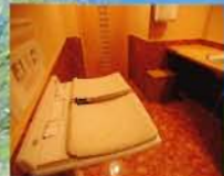
お母さんに優しいベビーベッド おむつ替えにも便利なベビー ベッド付の化粧室はどなたでも 自由どうぞ。