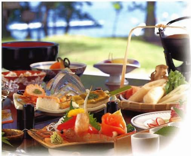
御食事 体をいたわる旬の素材を吟味しております。