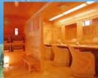
大浴場、貸切風呂の洗面台 車椅子の湯ま洗面台に届かう ことのできる高さにテーブル を取付けています。