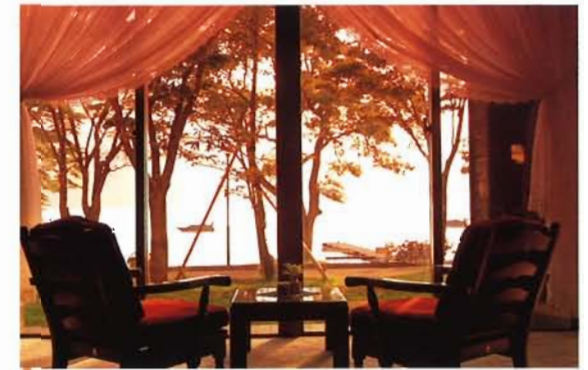
コーヒーラウンジ 時間毎に表情を変える十和田湖の景色とおつき合いください。