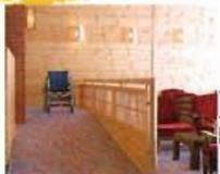
館内各所のスロープ エントランス、ロビー、廊下、 お風呂とスロープを取り付け ました。