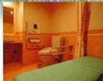
大人の方のおむつ交換ができる 車椅子専用トイレ 普通浴の方以外でもご利用いただけ る車椅子専用トイレもございます。 左右手すり、内鍵有、呼出有 入口開口 90cm 幅 2m 奥行 2m60cm